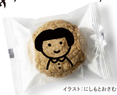
イラスト: にしもとおさむ