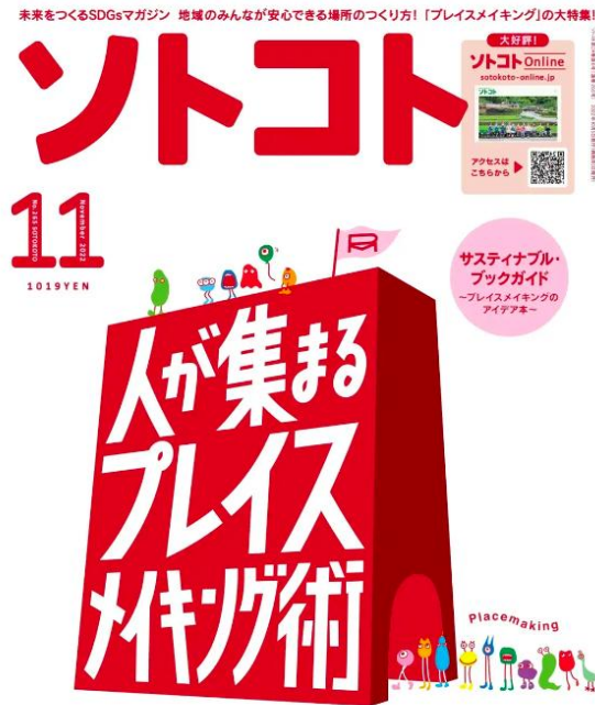
「ソトコト」2022年11月号 弊社が特集されました。