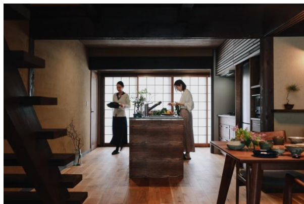
古民家宿 stay & explore

そんな想いを通じ、日々の暮らしが豊かになるような、 みなさまと熊川宿のささやかなつながりをつくることができたらと願っています。