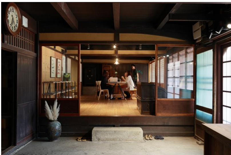
古民家を活用したシェアオフィス