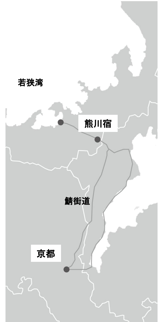
滋賀県と福井県の県境