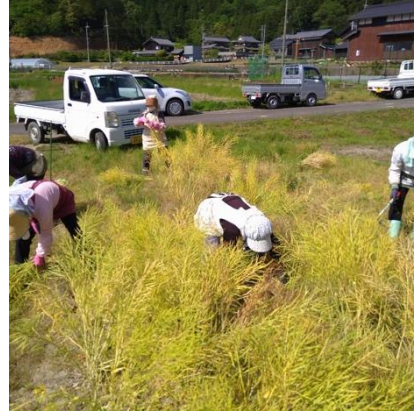
花が咲き終わったら収穫する