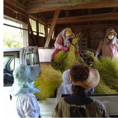
トラックで倉庫まで運ぶ