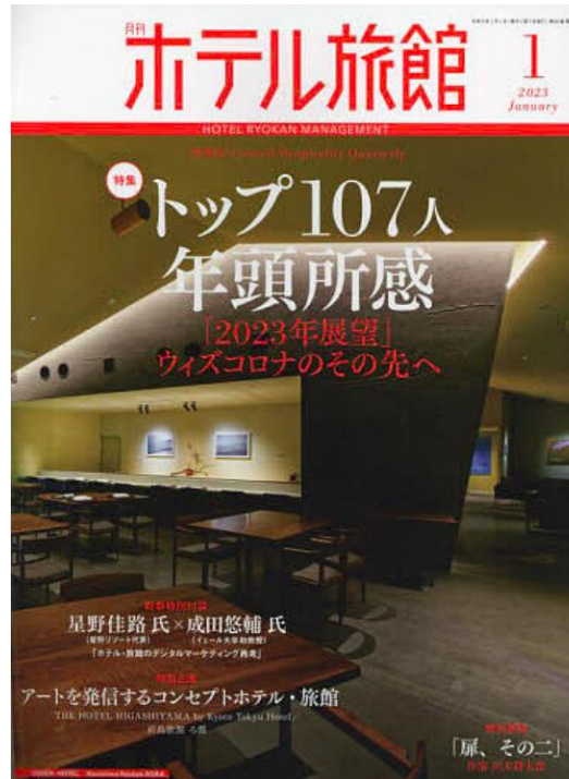
「ホテル旅館」2023年1月号 八百熊川の宿と食品が特集されました。