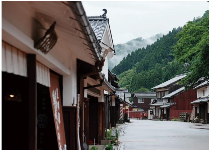
谷間にある約1kmの街道集落

今も残る江戸期に形成された町並みは、平成8年に重要伝統的建造物群保存地区に選定され、平成27年に「御食国若狭と鯖街道」として日本遺産に認定されています。