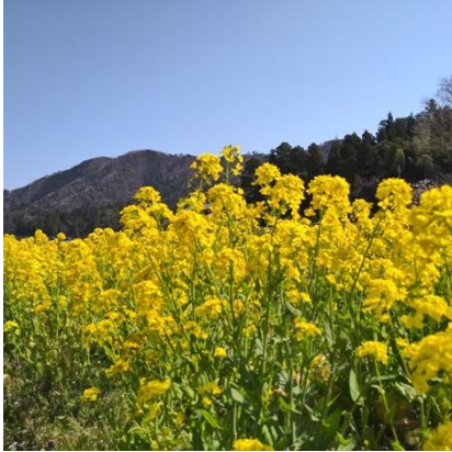
カブラの花が咲く