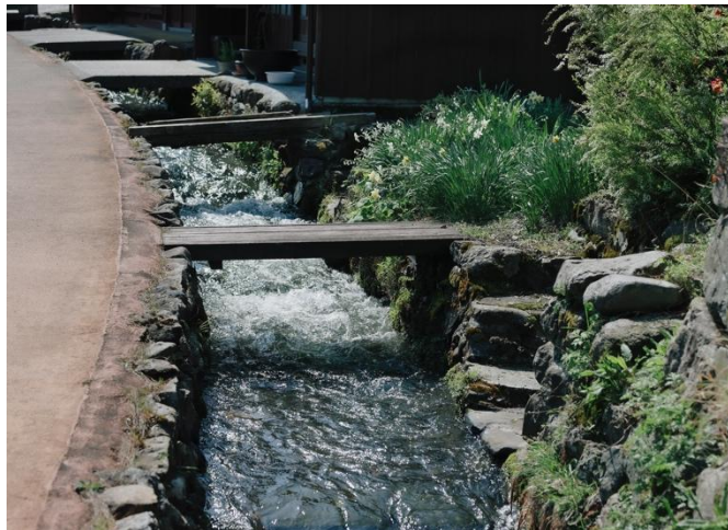
街道には生活用水路が流れている