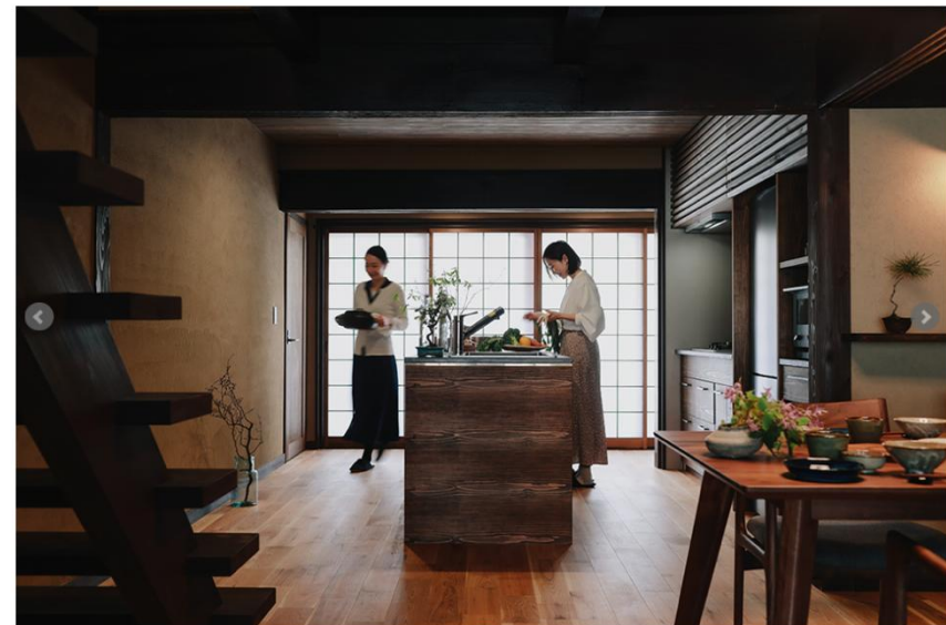
ふるさと名品オブ・ザ・イヤー2021年度 地方創生賞受賞しました