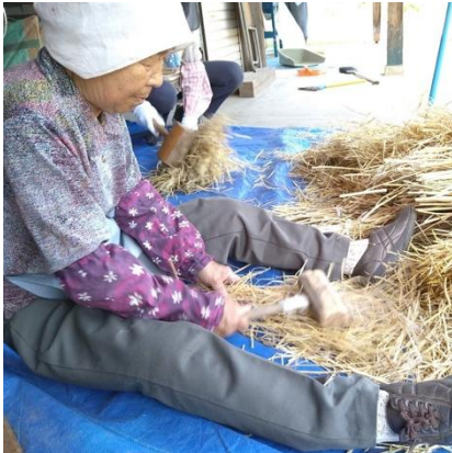
小槌で叩いてタネを出す