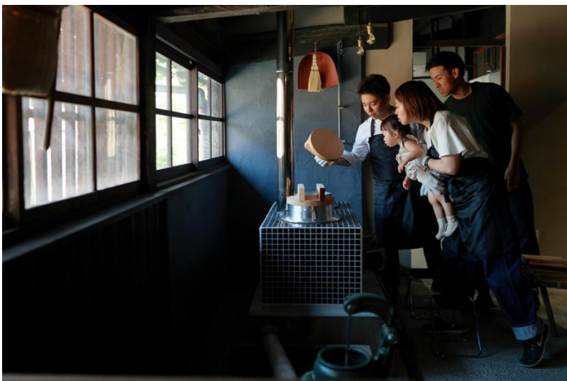
里山かまどご飯体験