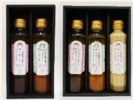
玉ねぎラブストーリードレッシング 2・3本セット