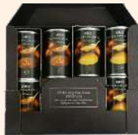
フルーツオニオンスープ缶 6本セット