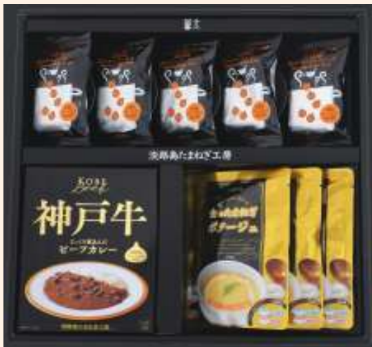
フルーツ玉ねぎスープ・カレーセットA