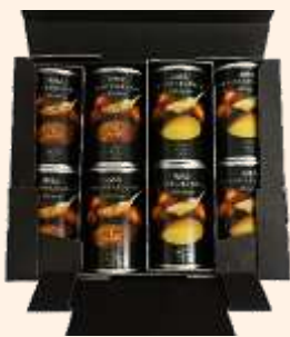
フルーツオニオンスープ缶 8本セット