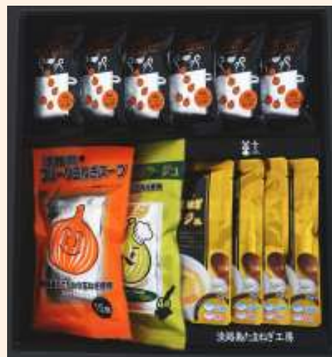
フルーツ玉ねぎスープセットB