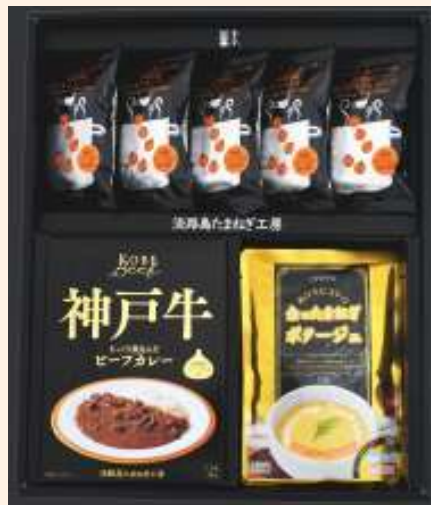
フルーツ玉ねぎスープ・カレーセットB