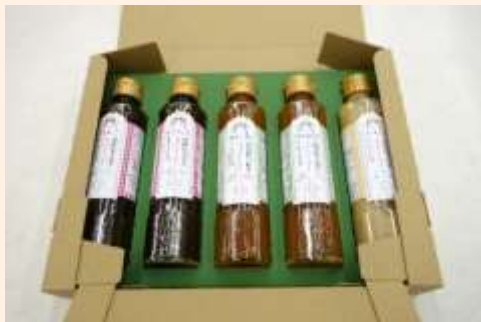
玉ねぎラブストーリードレッシング 5本セット