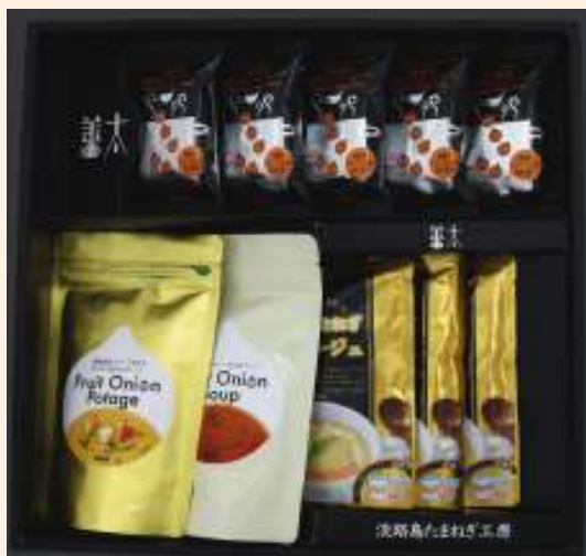
フルーツ玉ねぎスープセットA