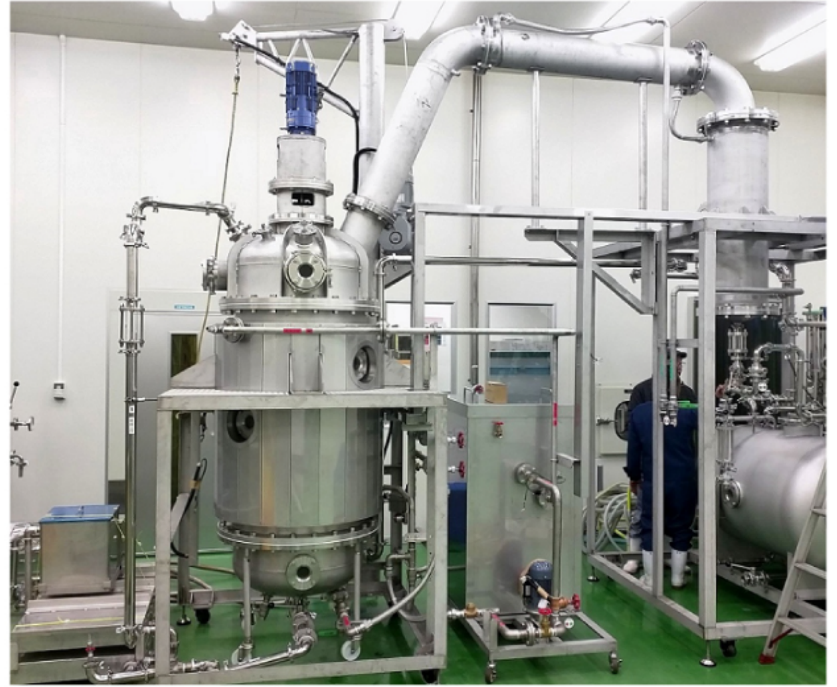
抽出・濃縮処理 - TLVC 装置