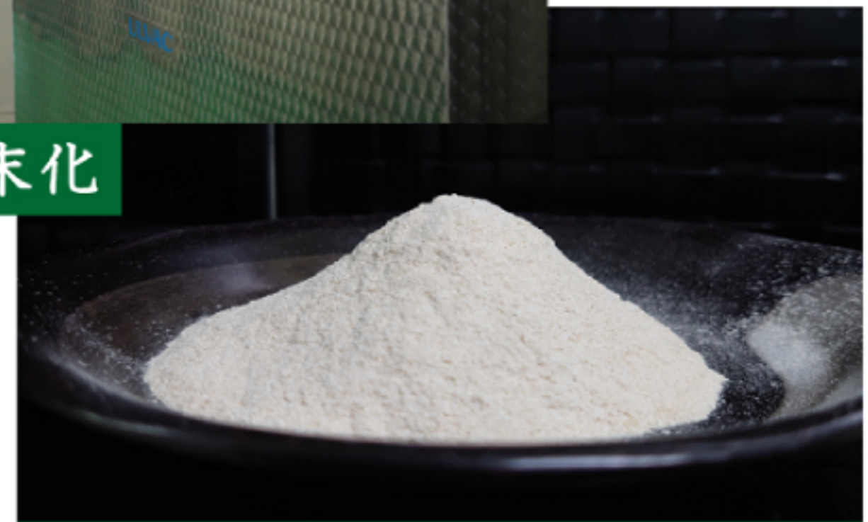
茶テアニン粉末 (40%含有品)