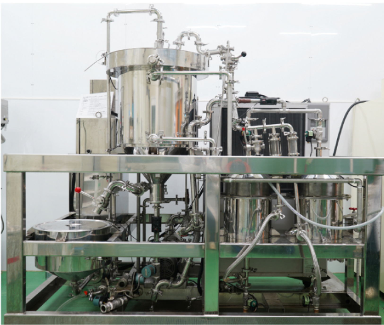
脱カフェイン・成分濃縮処理