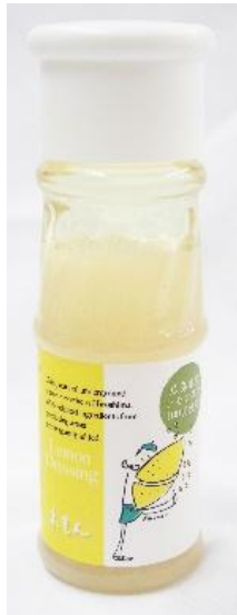
広島産 れもんどレッシング 130ml

センナリ株式会社 おいしさ研究所 大地 TEL 082-810-3000 FAX 082-810-3111 URL https://www.sennari-oochi.com Mail info@sennari-oochi.jp