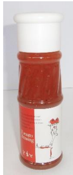
とまとドレッシング 130ml

瀬戸内海の温暖な気候で育った広島県産レモン果汁を、ふんだんに使用したドレッシングです。