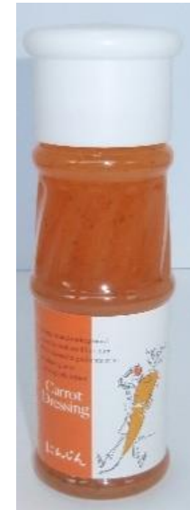
にんじんどレッシング 130ml

国産完熟トマトを贅沢に使い、国産純りんご酢、淡路島産玉ねぎ、広島県産レモン果汁、国産にんにく、国産パプリカなどで造りました。