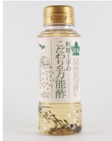
料理上手のこだわりの万能酢 180ml

酒から静置発酵法で造る天然水仕込みの純米酢を使用。厳選した広島産の柚子果汁、広島県製造の醤油を使用し、厚削りの鰹節を1枚そのまま加えた無添加のだしぼん酢です。鍋物以外にもマリネ液や煮物にも使いやすい万能なぼん酢です。お土産にもよろこばれます。