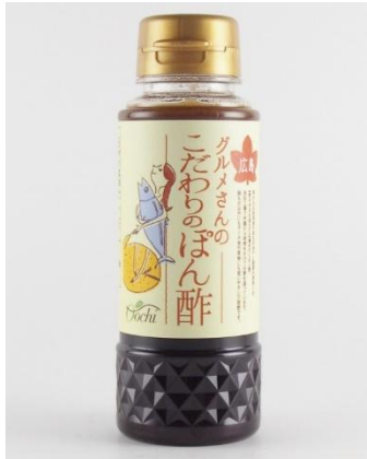
グルメさんのこだわりのぼん酢 180ml

センナリ株式会社 おいしさ研究所 大地 TEL 082-810-3000 FAX 082-810-3111 URL https://www.sennari-oochi.com Mail info@sennari-oochi.jp