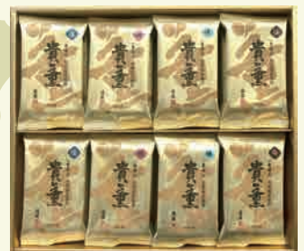
貴薫 40CN 4,320円

焼のり 6袋詰(6切5枚) 味付のり 6袋詰(6切5枚) 梅味のり 6袋詰(6切5枚) 塩のり 6袋詰(6切5枚)