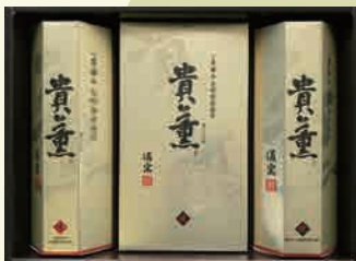
貴薫 50AN 5,400円

手巻のり4袋詰(2切5枚)×1箱 焼のり 12袋詰(8切5枚)×1本 味付のり12袋詰(8切5枚)×1本