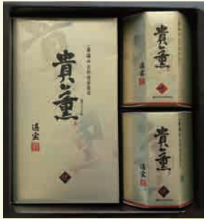
貴薫 20BN 2,160円

手巻のり2袋詰(2切5枚)×1箱 焼のり 8切20枚×1本 味付のり8切20枚×1本