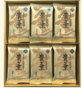
貴薫 30CN 3,240円

焼のり 3袋詰(6切5枚) 味付のり 3袋詰(6切5枚) 梅味のり 6袋詰(6切5枚) 塩のり 6袋詰(6切5枚)