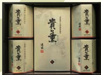
貴薫 40BN 4,320円

手巻のり4袋詰(2切5枚)×1箱 焼のり 8切20枚×2本 味付のり8切20枚×2本