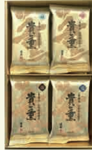
貴薫 20CN 2,160円

焼のり 3袋詰(6切5枚) 味付のり 3袋詰(6切5枚) 梅味のり 3袋詰(6切5枚) 塩のり 3袋詰(6切5枚)