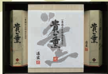
貴薫 80AN 8,640円

焼のり 板のり5枚×5袋×1箱 焼のり 12袋詰(8切5枚)×1本 味付のり 12袋詰(8切5枚)×1本