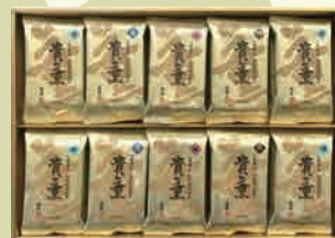
貴薫 50CN 5,400円

焼のり 6袋詰(6切5枚) 味付のり 12袋詰(6切5枚) 梅味のり 6袋詰(6切5枚) 塩のり 6袋詰(6切5枚)