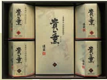
貴薫 30BN 3,240円

手巻のり2袋詰(2切5枚)×1箱 焼のり 8切20枚×2本 味付のり8切20枚×2本