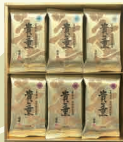
貴薫 30CXN 3,240円