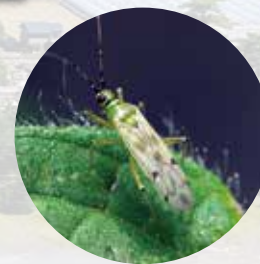
天敵昆虫(タバコカスミカメ)