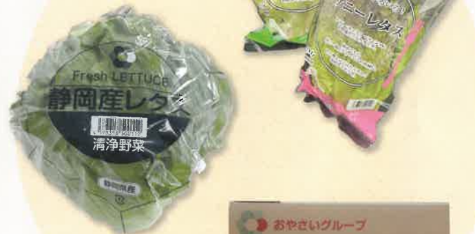
デザインの統一感が ブランドイメージを高めます