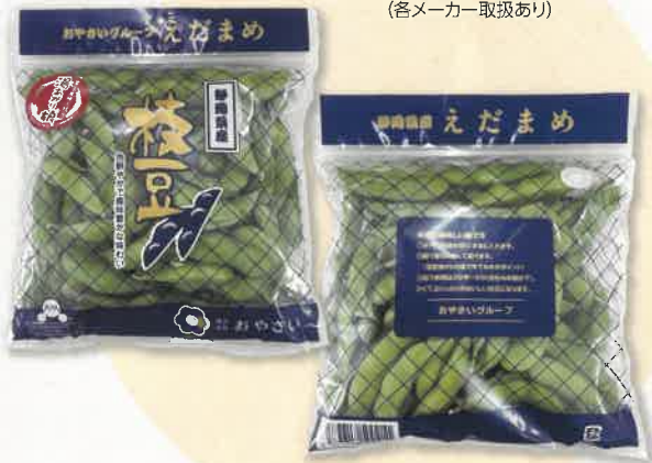
鮮度保持袋を使用 (各メーカー取扱あり)