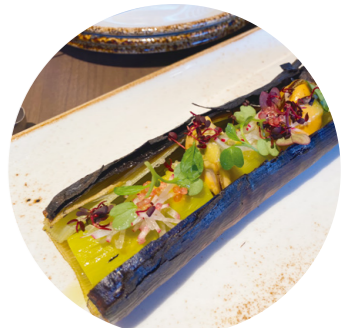
下仁田ねぎとムール貝のオープン焼き