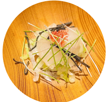
とら河豚の昆布締め