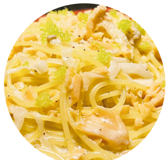
サーモンクリームパスタ