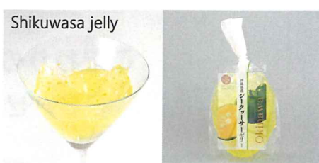
沖縄産シークワサーゼリー 【内容量】170g 【使用果実】沖縄産シークワサー