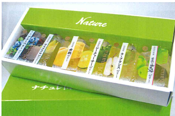
詰め合わせセット(6個入り) ※季節によって商品の取合せが変わります