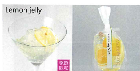
神奈川県産レモンゼリー 【内容量】170g 【使用果実】神奈川県産レモン