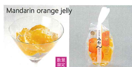
神奈川県産小田原みかんゼリー 【内容量】170g 【使用果実】小田原産みかん