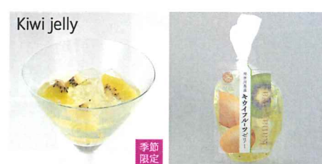
神奈川県産キウイフルーツゼリー 【内容量】170g 【使用果実】神奈川県産キウイフルーツ