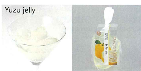
神奈川県藤野産ゆずゼリー 【内容量】170g 【使用果実】藤野町産ゆず