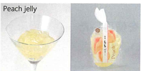
国産ももゼリー 【内容量】170g 【使用果実】国産白桃