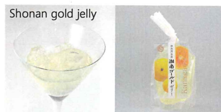
神奈川県産湘南ゴールドゼリー 【内容量】170g 【使用果実】神奈川県産湘南ゴールド