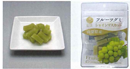
山梨県産シャインマスカットグミ 【内容量】45g 【使用果実】山梨県産シャインマスカット