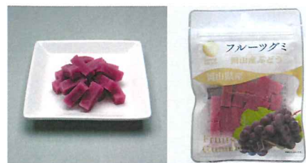
岡山県産ぶどうグミ 【内容量】50g 【使用果実】岡山県産ぶどう