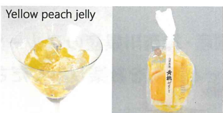
山形県産黄桃ゼリー 【内容量】170g 【使用果実】山形産黄桃