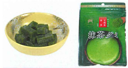
神奈川県産抹茶グミ 【内容量】50g 【使用茶葉】神奈川県産抹茶 緑茶