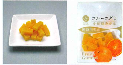
神奈川県産小田原みかんグミ 【内容量】50g 【使用果実】小田原産みかん