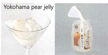
神奈川県産横浜なしゼリー 【内容量】170g 【使用果実】横浜産なし