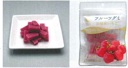
宮城県産いちごグミ 【内容量】50g 【使用果実】宮城県産いちご