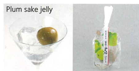
神奈川県産曾我の梅酒梅ゼリー 【内容量】170g 【使用果実】神奈川県産曾我の梅