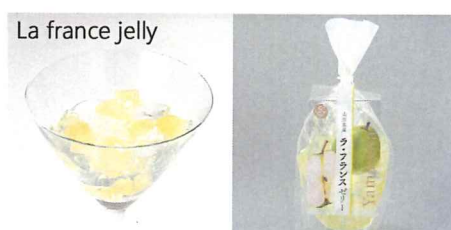
山形県産ラフランスゼリー 【内容量】170g 【使用果実】山形産ラフランス