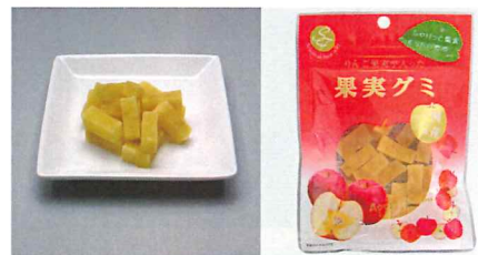
国産りんごグミ 【内容量】50g 【使用果実】国産ふじりんご