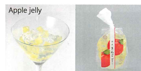
国産りんごゼリー 【内容量】170g 【使用果実】国産りんご