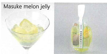
静岡県産マスクメロンゼリー 【内容量】170g 【使用果実】静岡県産マスクメロン