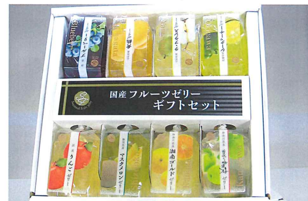
詰め合わせセット(8個入り) ※季節によって商品の取合せが変わります