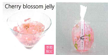
神奈川県産桜ゼリー 【内容量】170g 【使用果実】神奈川県産八重桜