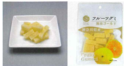
神奈川県産湘南ゴールドグミ 【内容量】50g 【使用果実】神奈川県産湘南ゴールド