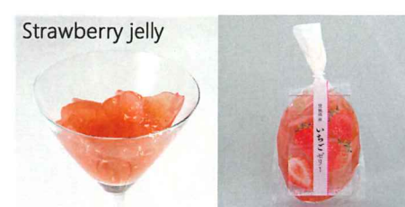
宮城県産いちごゼリー 【内容量】170g 【使用果実】宮城県産いちご