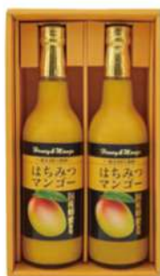
102 はちみつマンゴー ドリンクセット HM2