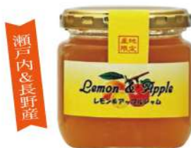
70 レモン&アップルジャム