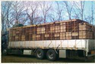
このトラックのミツバチは鹿児島島の種子島へ