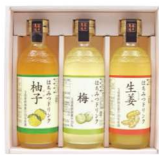
103 ドリンクセット FH-30