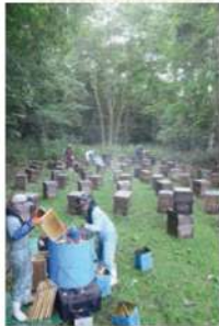
北海道でのボダイジュ採蜜 この日は東京から取材の訪問有