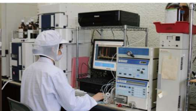
はちみつ中の糖類の割合を分析