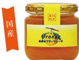
72 あまなつマーマレード