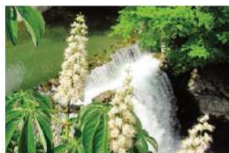
リンゴの花の次は巣箱を山に移してトチの花