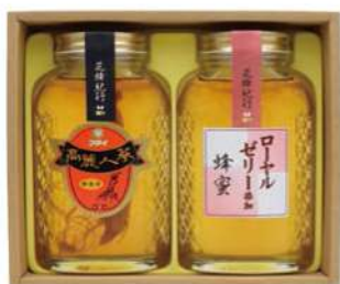
101 フジイはちみつ KS-60