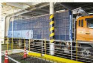
ミツバチは船で北海道へ移動