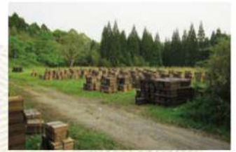
九州から青森へ移動の準備。巣箱を集める(熊本)