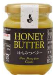
数量限定品 75 はちみつバター