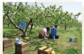
リンゴ畑での採蜜