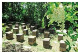
トチの花の次はアカシアの花。アカシアが終わると北海道へ