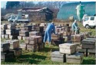
冬が近くなり九州へ帰るため巣箱を集める