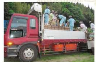
仲間の養蜂家も駆けつけトラックへの積み込み