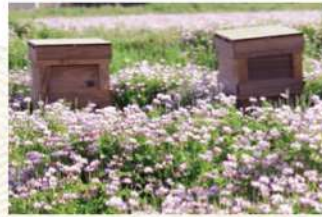
レンゲはちみつが生産シーズンのスタート。鹿児島県国分でのレンゲ満開