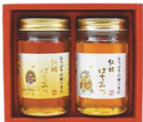
99 フジイはちみつ TM-30