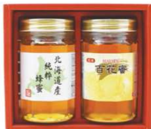
100 フジイはちみつ HK-50