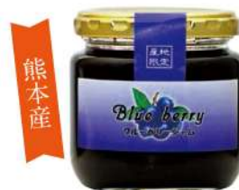
71 ブルーベリージャム