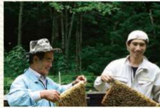
会長と息子である社長のツーショット。二人合せての養蜂歴は80年、ミツバチとのふれあい歴は100年