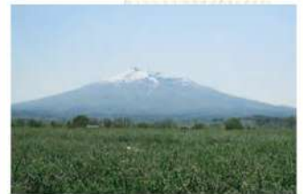
約25時間トラックで陸走後、津軽へ到着。見渡す限り広がるリンゴ畑と岩木山。