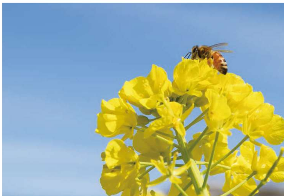
菜の花とミツバチ

朝倉の地に創業して115年が過ぎました。 明治42年(1909年)、農業と養蜂業に従事し、 当時としては珍しい西洋ミツバチの導入を行いました。 本格的な「蜂屋」としての誕生です。 自然の恵みに感謝し、ミツバチと共に生きていく 養蜂の基本姿勢は創業当時と変わりません。 これからの新しい「令和」の時代も、 皆様に喜んでいただけることを楽しみに いろいろな商品を作ってまいります。