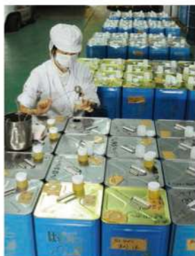
サンプリングしたはちみつ

全国各地で採蜜したはちみつが工場に入荷されます。入荷したはちみつは一缶ずつサンプルを取り、自社品質管理室で検査を行います。糖分析、抗生物質などの品質検査を行い安全性を確保します。検査に合格したはちみつだけが衛生管理の行き届いた設備で瓶詰され、商品化されています。