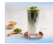
粉ドレサラダ・野菜スムージー