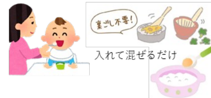
入れて混ぜるだけ