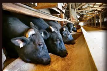
〔炊き餌を食べる牛〕