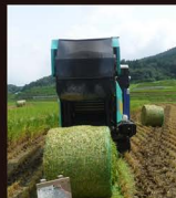
〔牛の飼料になる稲ワラ〕

また、町内事業者が協力してさつま町の逸品を全国に届ける地域ブランド「薩摩のさつま」に登録しています。商品購入が町の子どもの教育やスポーツ振興に繋がります。イベント出店などを通じて、町の未来を育んでいます。