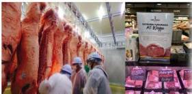
(輸出する技術を選定する様子)

2023年7月から 輸出 を始めました。「さつま福永牛」のブランド価値を崩さず、一頭買いでくださる方もお取引しています。今後ぜひ「さつま福永牛」を海外へも広げていきたいです。