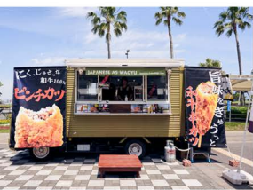
(マリンポートかごしま、クルーズ船のお客様へ向けに出張している様子)

現在は、マリンポートかごしま、AMU、センタラスを中心に販売しています。今後も新しい商品の開発や出店先を広げていきます。