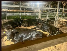
〔リラックスしている牛たち〕

こまめに入れ替えるふかふかのおがくず床、夏は扇風機とミストシャワーで快適な空間を維持しています。毎日流れるジャズやクラシックによりストレスフリーな環境をつくり、牛がお腹を出して寝るほどリラックスできる環境が肉質にいい影響を与えると考えられています。また、アニマルウェルフェアの理念に基づき、牛がストレスなく健康的な生活を送るための取り組みを行っています。