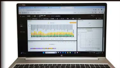
〔パソコン上でデータ管理〕

肥育牛、繁殖牛、子牛、それぞれに特化したICT機器を積極的に導入し、疾病の予防や早期発見、繁殖牛の妊娠率向上を実現しました。作業効率が向上し、正確な管理が可能になりました。ICT機器と人間の役割を明確化し、スマートな畜産管理を実現しています。