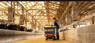
〔炊き餌を与える従業員〕

毎朝、穀物等の独自ブレンドしたものを専用釜で蒸すと、牛舎には、湯気とともに穀物の甘い香りが立ち上ります。まるで人のごはんと同じように作った「炊き餌」を肥育後期牛に与えることで、肉が柔らかく「甘味と照り」が引き立ちます。脂肪の融点下ががり、口に入れた瞬間、とろけるような食感を楽しめます。手間を惜しまないこの昔ながらの製法は、美味しいお肉をつくるために欠かせないこだわりです。