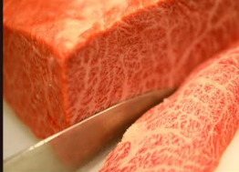
(サロシンスステーキ)

抜群の霜降り肉でありながら、しつこくない上品な後味。ひとつ口に入ればそのみけるような口当たりが驚くでしょう！牛肉は、オレイン酸の割合が高いものほど、美味しいとされています。枝肉共助会で「さつま福永牛」は脂肪質が優れていると審査員の満票を獲得し、グランドチャンピオンに3度、輝いた実績があります。和牛オリンピックと言って、全国から優れた牛が集まる大会があり、その大会の中には、脂肪の質を競う部門があります。その部門のMUFA予測値平均は、57.6%。「さつま福永牛」はその値をはるかに上回る62%が平均です。また、口溶けにつながる脂の地点について、和牛の平均が15～30℃であるのに対し、さつま福永牛は13℃。なので、「さつま福永牛」は、口に入れた瞬間溶けるのです。