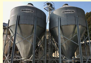
トウモロコシをひき割るプラント

通常の設備では配合と給餌が出来ないため、私たちは飼料に合わせて独自の配合機を作り使用しています。 また徹底的な衛生管理が行えるひな壇方式の 1 鶏舎 1 ライン方式の鶏舎は、 優しい太陽の光と澄んだ空気をいっぱいにとり入れられる独自設計施行鶏舎です。