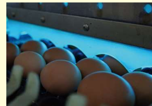
雑菌を駆除する紫外線殺菌